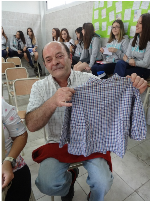
Fig. 9: Ex alumno mostrando el uniforme que usaba para asistir a clases