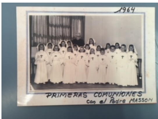
Fig. 5: Primera comunión, 1964