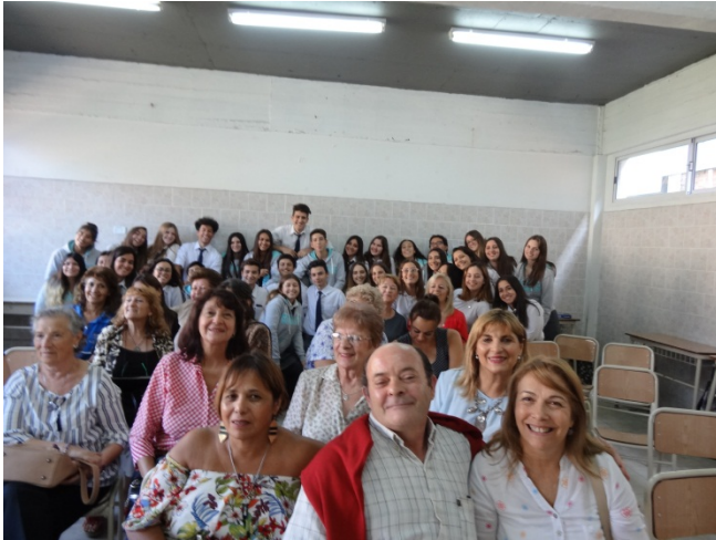
Fig. 7: Reunión de ex-alumnos, 19 de abril de 2018