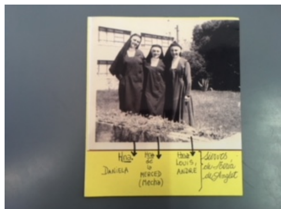
Fig. 6: Servas de María de Anglet