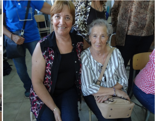
Fig. 8: Primeras alumnas del colegio